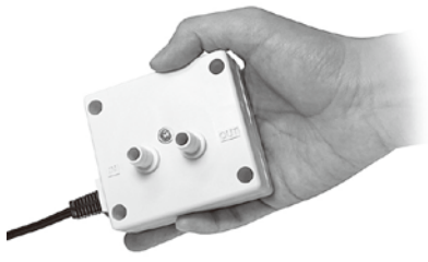
日東工器株式会社 圧電ポンプ「バイモルポンプBPHSシリーズ」

日東工器は、バイモルフ振動子を使用した圧電ポンプ「バイモルポンプ」シリーズに、高流量タイプの「BPHS-414/BPHS-474」を新たにラインアップし、11月上旬から本格発売した。